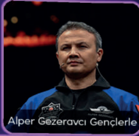
Alper Gezeravcı Gençlerle