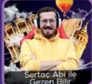
Sertaç Abi ile Gezen Bilir