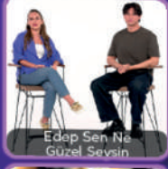
Edap Sen Ne Güzel Sevsin