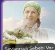
Seviyorsak Sebebi Var