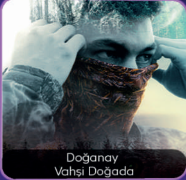
Doğanay Vahşi Doğada