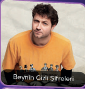
Beynin Gizli Şifreleri